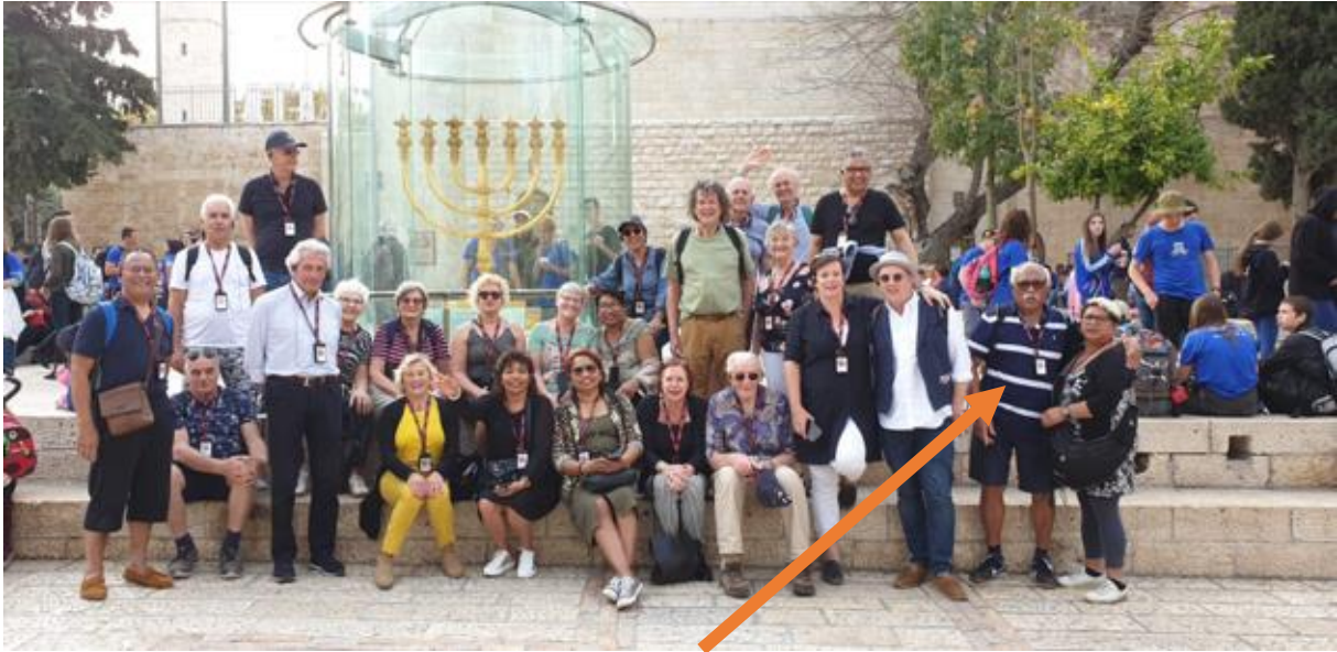
Semua orang jg bukan belanja di Lidl, untung lagi bung dapat lihat folder Wat een geschenk, dank u bung Henk.